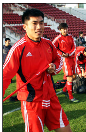
▲中国队进攻核心郑智剑拔弩张。

在Bet365公司的花式玩法中,还有哪个队先进球这一项。伊拉克队的赔率为1赔1.72,中国队为1赔2.50,双方的差距还拉得比较大。由于中国队总是在比赛中