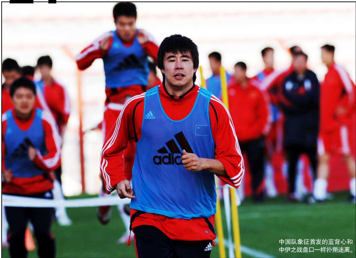
中国队象征首发的蓝背心和 中伊之战盘口一样扑朔迷离。

记者陆慧明报道 从盘口层面角度分析,中伊之战的变化情况甚至是亚洲区20强赛首轮最为精彩的比赛。操盘手先是开出伊拉克让中国半一的深盘,而后比赛前一天竟然最低到平半,赛前数小时则在半球和平半之间来回摇摆,这种走势会让很多博彩者产生困惑。